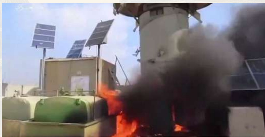
Gambar 2. Brigade Al-Qassam mengambil alih pangkalan militer Nahal Oz pada 7 Oktober 6