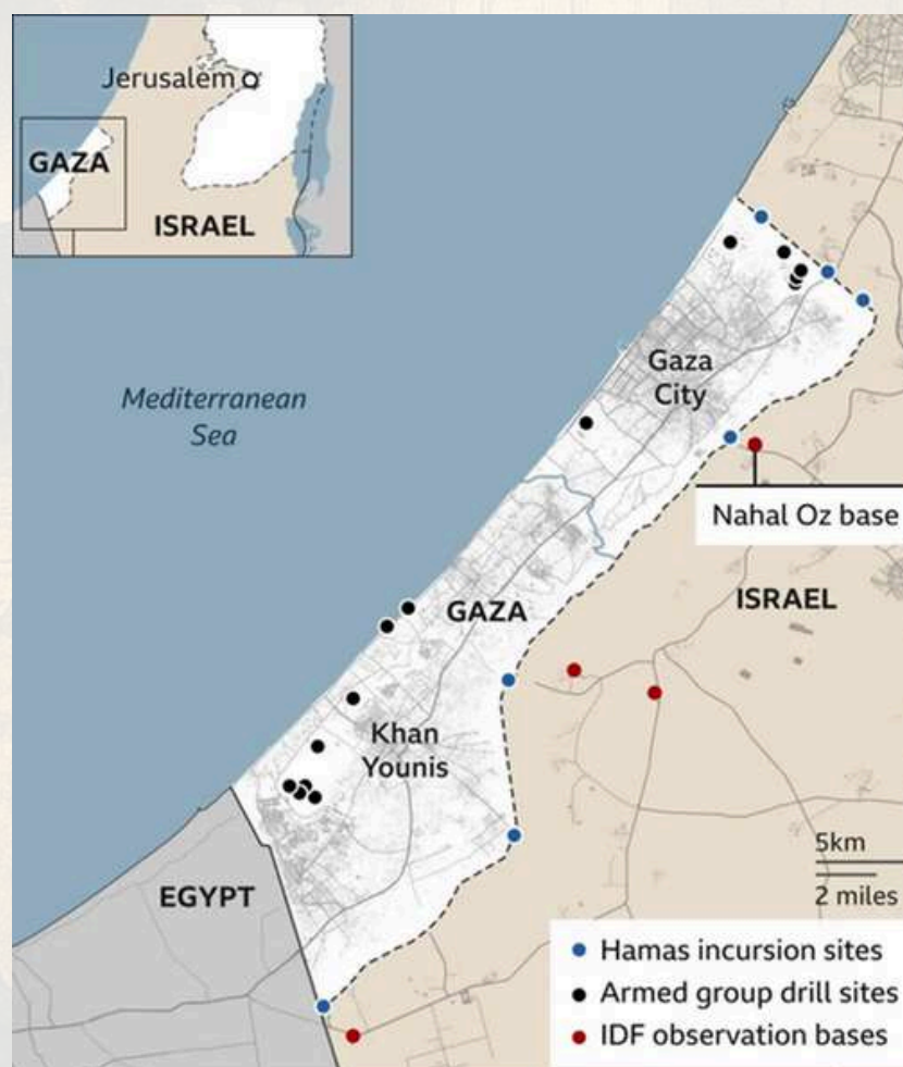
Gambar 1. Pangkalan militer Nahal Oz yang menjaga perbatasan Israel dengan Gaza 5

Dengan demikian, terlambatnya Israel mengantisipasi dan menanggapi serangan kejutan Hamas datang dari masalah yang terjadi di berbagai tingkatan dinas intelijen, eselon politik dan militer atas. Baik pengumpulan, analisis, dan penyebaran informasi intelijen maupun penilaian politik Israel secara keseluruhan terhambat oleh kelalaian dan kegagalan mereka. Hal tersebut berdampak pada penilaian yang salah terhadap niat dan kemampuan Hamas. Israel meremehkan kemampuan Hamas dan terlalu melebihkan kemampuan teknologi. Dalam hal ini serangan Hamas pada 7 Oktober menunjukkan bahwa aktor non-negara tersebut dapat menghadapi musuh yang lebih kuat. 3 Keyakinan yang selama ini pemerintah Israel percaya bahwa Hamas tidak akan berani menyerang karena tidak memiliki kemampuan untuk melakukannya, terpatahkan oleh adanya serangan tersebut. Keyakinan itu membuat para pejabat Israel mengabaikan bukti-bukti yang terus berkembang dan bertentangan dengan keyakinan mereka. Para pejabat keamanan Israel tidak belajar dari kegagalan intelijennya ketika tentara Suriah dan Mesir menyerbu pertahanan Israel pada Perang 1973. Mengabaikan peningkatan kemampuan militer Hamas dan berpikir bahwa Hamas tidak sedang tertarik untuk berperang dengan Israel membawa Israel pada kegagalan yang sama. 4