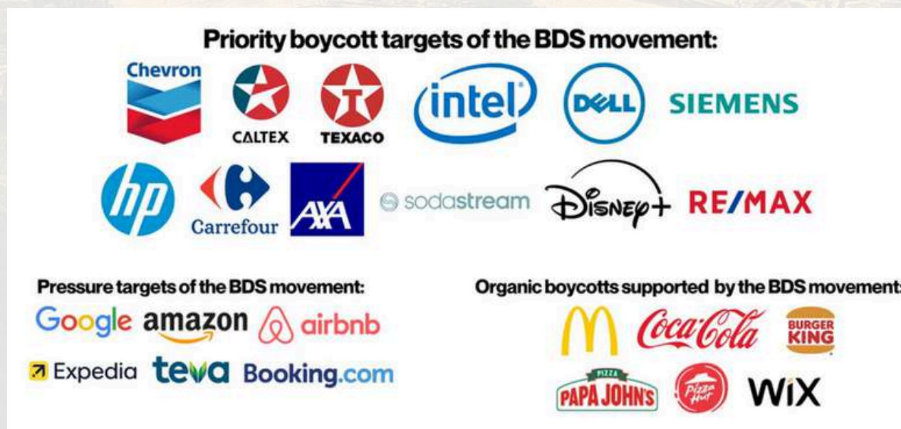
Gambar 6. Prioritas perusahaan-perusahaan yang menjadi target boikot secara global 21

Dengan demikian, gerakan BDS menyerukan untuk memboikot dan melakukan divestasi dari semua perusahaan Israel yang sejauh ini tidak ada yang memenuhi dua kondisi di atas.