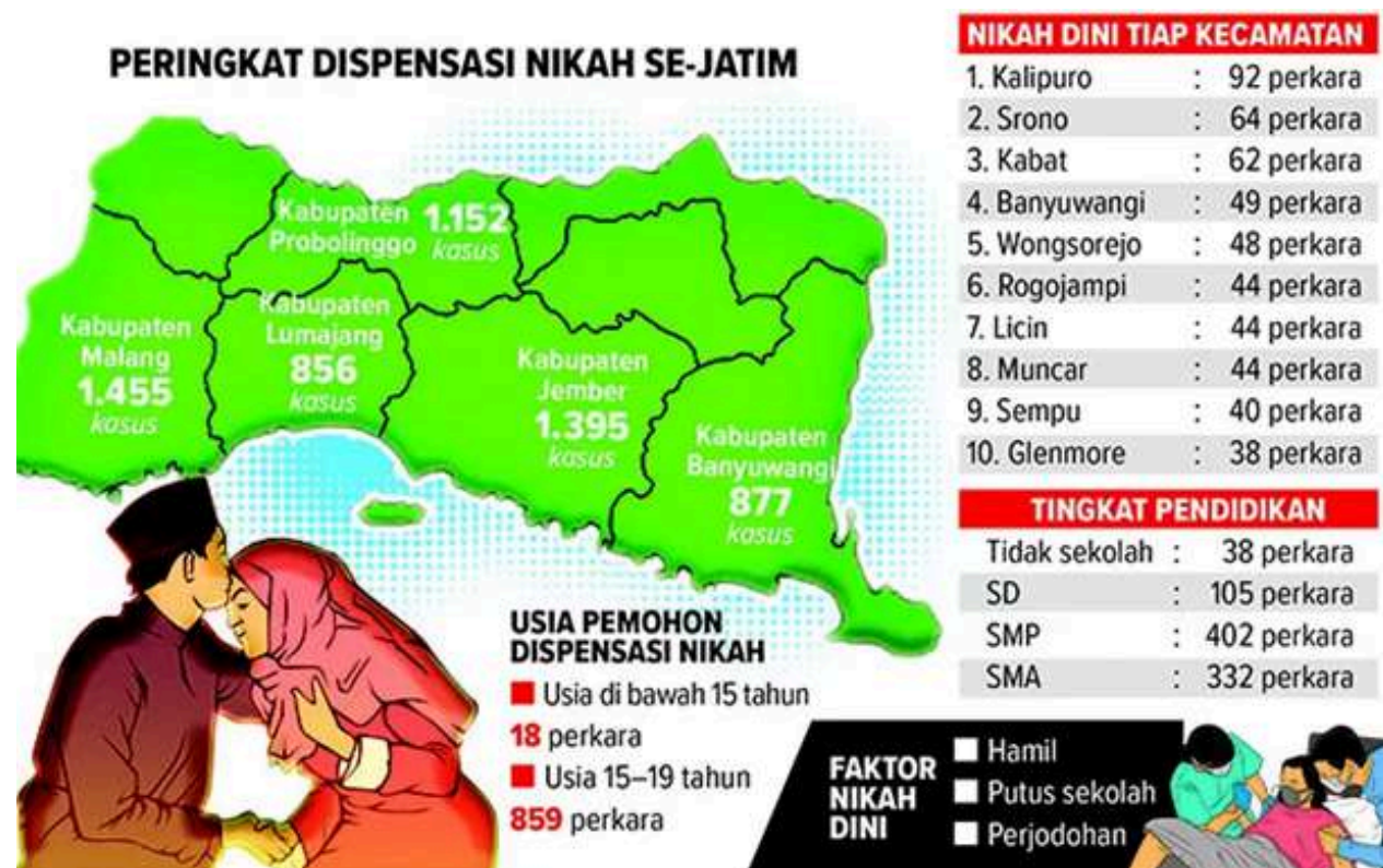
(Keterangan foto: Angka pernikahan dini di Banyuwangi tergolong tinggi. Kabupaten di ujung timur Pulau Jawa ini bahkan masuk peringkat empat di Jawa Timur). 12

Sementara itu, isu yang terkait dengan batasan interaksi ini kemudian muncul dalam bentuk yang lebih kompleks, di antaranya pernikahan dini yang sering kali menjadi hasil dari interaksi sosial yang tidak terkontrol. Salah satu contoh yang menonjol adalah tingginya angka permohonan dispensasi nikah di beberapa daerah. Hal ini layaknya cermin retak dari persoalan sosial yang akut.