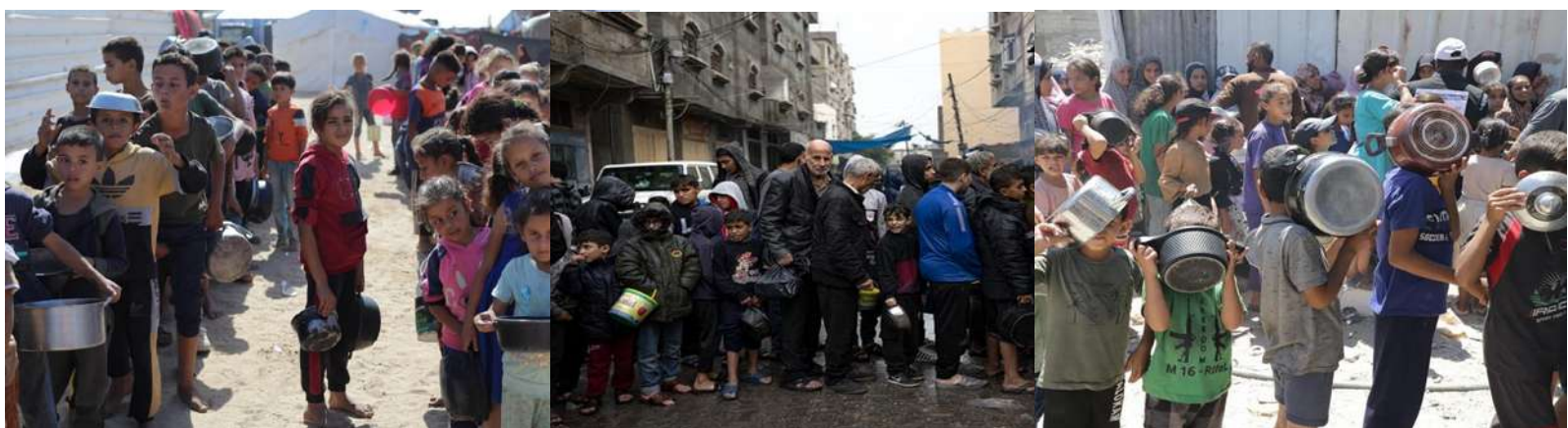
(Keterangan foto: Krisis pangan yang parah di Gaza, 2 juta penduduk bergantung pada bantuan. 21 April 2025) 9

Dalam tekanan kekerasan psikis dan fisik oleh penjajah zionis Israel, suasana keimanan tetap kuat terjaga. Inilah yang membentuk mentalitas pantang menyerah bagi generasi. Apapun situasinya, menjunjung tinggi ketaatan terhadap hukum Allah adalah kewajiban yang harus ditegakkan.