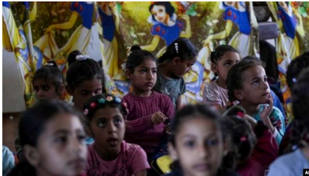
(Keterangan foto: Untuk anak-anak Gaza, perang berarti tidak ada sekolah — dan tidak ada kepastian kapan pembelajaran formal akan kembali dimulai. 17 Mei 2024) 8

Bahkan dalam situasi darurat, perjalanan literasi generasi Gaza tetap terjaga dalam batasan-batasan syariat. Manifestasi pemahaman yang kuat mengakar tentang hukum Allah terkait ikhtilâṭ dan khalwat nampak jelas dalam penyikapan mereka melalui penjagaan interaksi. Hal itu juga diupayakan meski dalam suasana pengungsian.