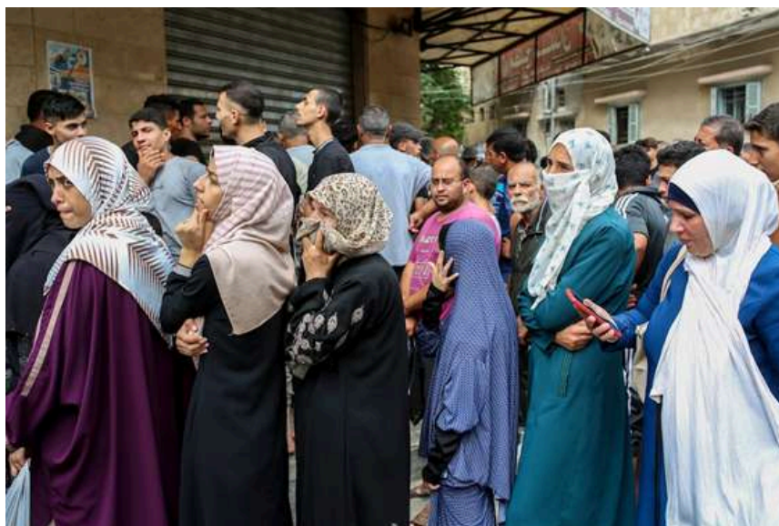
[Keterangan foto: Arab Saudi Memulai Upaya Bantuan untuk Gaza dan Mengumpulkan 17 Juta Dolar dalam Beberapa Jam, 02 November 2023]